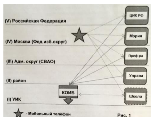
Рис. 1 УИКи: (I)-УИК, (II)-район, (III)-административный округ, (IV)-город, (V) ЦИК РФ.

Президентские выборы-2018 имели важную особенность: на избирательных участках появились КОИБ-2017, автоматы нового поколения с автоматической передачей данных (с USB-модемом, использующих сотовую связь для передачи данных). Оснащение участков избирательных комиссий (УИК) такими КОИБ позволяет управлять избирательным процессом из любой точки ГАС «Выборы». На рис.1 дана схема передачи информации в федеральном избирательном округе с 5-ю уров-