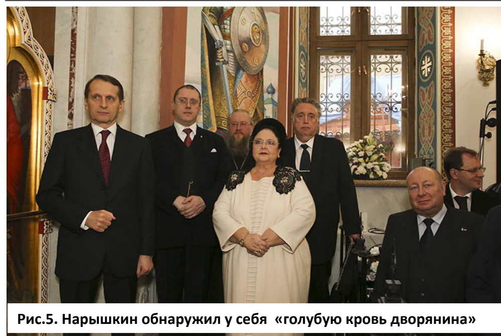
Рис.5. Нарышкин обнаружил у себя «голубую кровь дворянина»

лица земли в 2016г., и таких заводов десятки тысяч по всей стране.