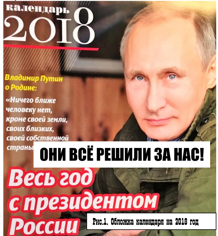
Рис.1. Обложка календаря на 2018 год

В конце 80-х годов мы были в лидерах среди станкостроительных держав, наши станки тысячами закупали Германия и Япония. Теперь мы вынуждены приобретать станки и оборудование у КНДР и Китая.