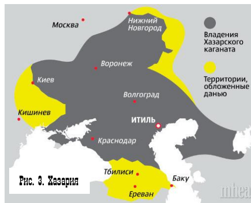
Рис. 3. Хазария

22 ноября 2017г. в США прошёл мировой еврейский конгресс, на котором принято решение - считать Крым юридически российским, но форсировать проект КРЫМСКОЙ КАЛИФОРНИИ , который в 20-м веке евреям не дал реализовать Сталин. На конгрессе присутствовали раввины РФ и Севастополя. Можно предположить, что нынешних коренных жителей будет постепенно выдавливать с полуострова под раз-